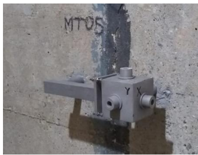
Imagem 3 – Medidor Triortogonal barragem Descoberto. Commetro, 2022.