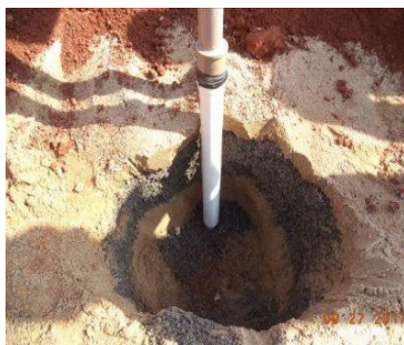
Imagem 1 – Piezômetro de PVC. Isbgeo, Sd.