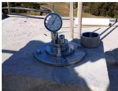
Imagem 2 – Extensômetro barragem Descoberto. Commetro, 2022.